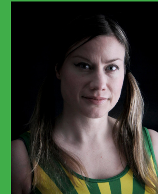
9 RACY CAT LADY