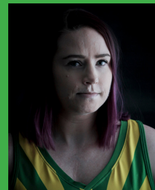
13 MARY THE SCARY