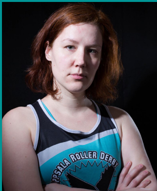
0 MONKEY MIND