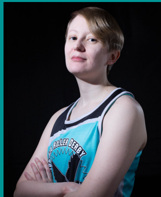
84 PANIC ATTACK