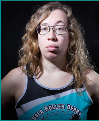
2 MAJA LA BAE