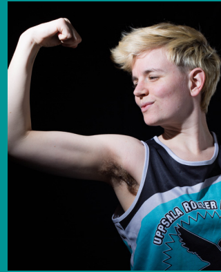
3 VAGINA DENTATA