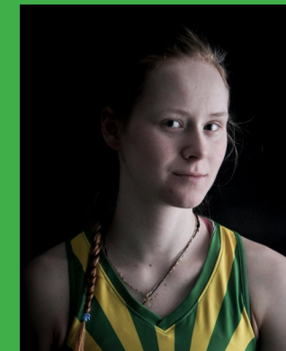
63 CHAMELEON CIRCUIT