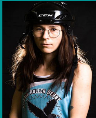
21 SKATE BUSH