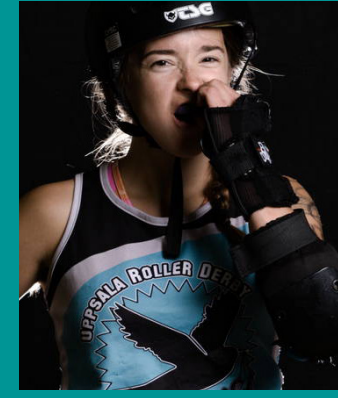
12 IMMORTAL KUMQUAT