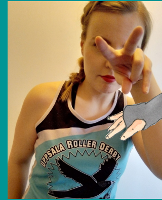
338 TRASH BUCKET