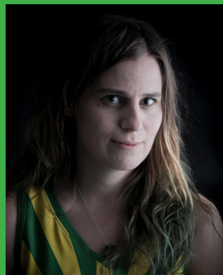
1 HELL I VIPERA